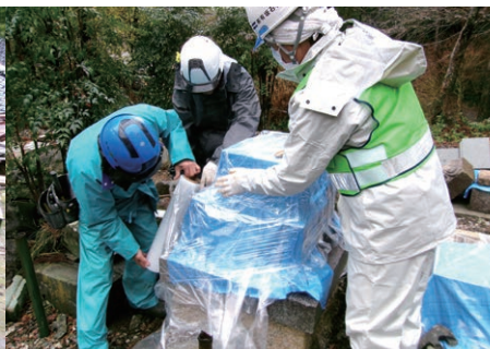
ご遺骨をブルーシートで覆う

石川県能登半島を震源とする大規模な地震により、お亡くなりになられた方々に謹んでお悔やみ申し上げますとともに、被災されたみなさまに心からお見舞い申し上げます。