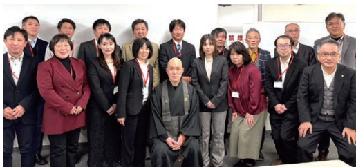
研修後、ウェルビーイングな笑顔の参加者