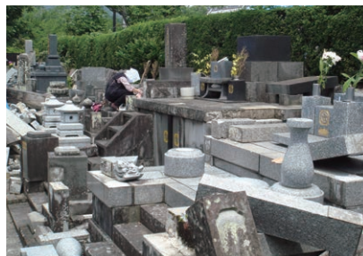
「平成28年度熊本地震」(2016年/熊本県熊本市)