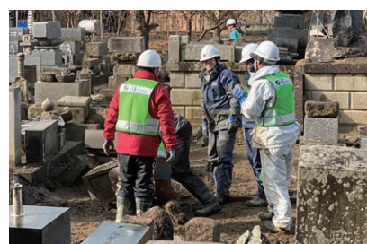
「台風19号」(2019年/長野市・妙笑寺) 力を合わせ、達成感の笑顔