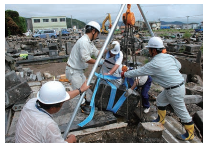
「東日本大震災」(2011年/宮城県石巻市・称法寺)