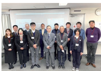
講師と委員会スタッフ