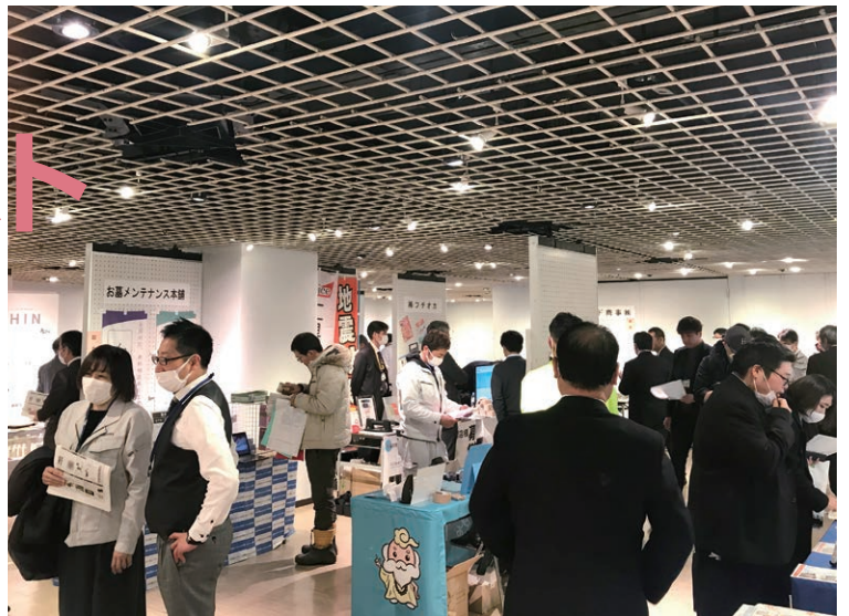
ストーンアシスト in 岩手(2020年2月)の様子

「ストーンアシスト」とは石産協の関連部会に所属する企業らが出展し、 石材店に役立つ最新の製品・情報・サービスなどを一堂で紹介する展示会です。