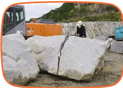
「うごかない〜!!」 大きな石を割る (5分30秒)