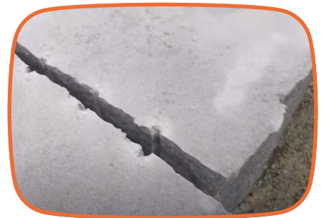
「親方〜!!」 お墓になる石を選ぶ (5分19秒)