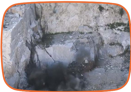
「ニョキッ!」お墓になる 石を山から見つける (4分57秒)

「墓石はどのようにつくられるの?」消費者の疑問に応える動画を3つのテーマで作成しました。知っているようで知らない石のこと。採石場で職人が切り出し、お墓になる石を選ぶ一連のお仕事現場をお墓ディレクターが取材しました。めったに見られない職人技は必見です。