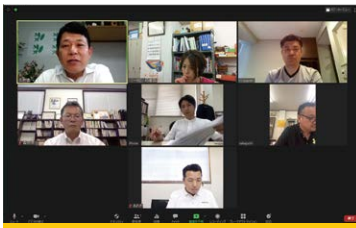
広報委員会(7月28日) オンライン参加:7名

コロナによってオンライン会議が活発に行われるようになったことは、良いことのひとつです。移動時間に制限がかからないことで、以前より参加し易くなったことや出張費が節約されるなど新たな発見が色々あります。しかしながら、リアル会議の大切さも同時に気づかされました。無駄ばなしから生まれるヒント、その場の空気感など…。オンライン、リアル会議ともにコミュニケーションの取り方はさまざまですが、集まって会議ができない時期ですから、今こそ最大限にオンライン会議を活用してまいりましょう。