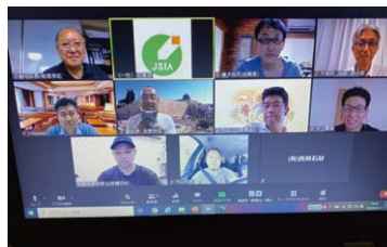
近畿地区支部長会議(8月17日) オンライン参加:10名