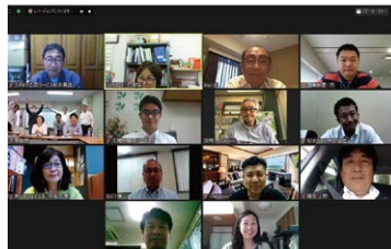
関連部会(7月29日) リアル参加:7名/オンライン参加:12名