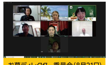
お墓ディレクター委員会(8月21日) オンライン参加:7名