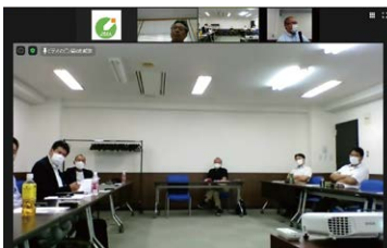
建築環境部会(8月7日) リアル参加:15名/オンライン参加:1名