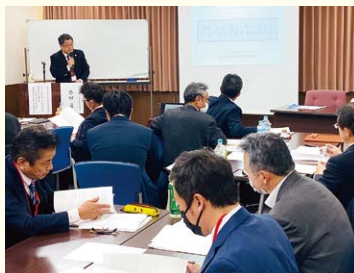
成果普及講習会での解説