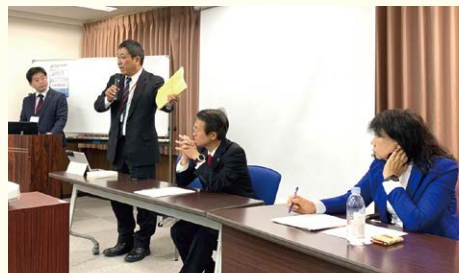
墓石部会でのパネルディスカッション