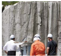
ワイヤーソーによる採石(滝根みかげ丁場にて)