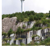
風車が間近に見える滝根みかげ丁場