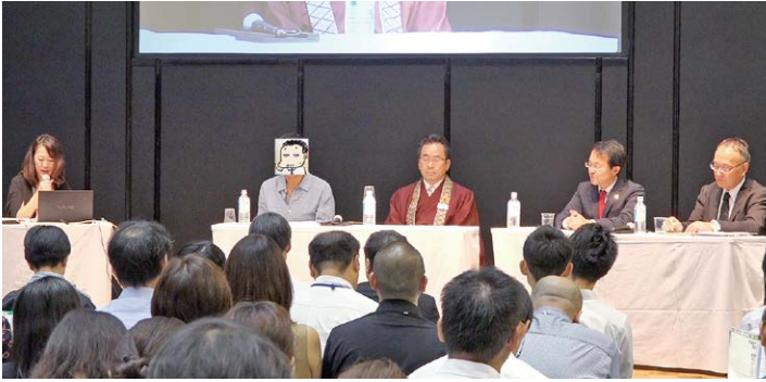
業界代表者によるパネルディスカッション 射場会長出演