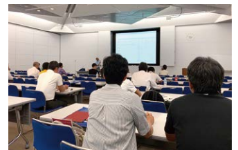
1級取得にチャレンジ！ お墓ディレクター委員会