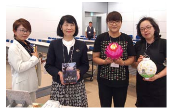
輝かしい女性の活躍 女性ネットワーク委員会