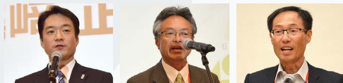
高知県知事 尾崎正直氏