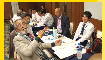
質問票に目を通す担当理事