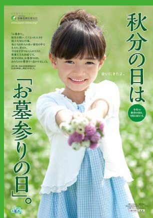
「お墓参りの日」PR用ポスター2007年度版

「秋分の日」は「祖先をうやまい、なくなった人々をしのぶ」と法律で定められています。2013年当会では秋分の日を「お墓参りの日」と制定したのは、必然的にお墓参りを啓発する格好のチャンスとらえたからなのです。墓石を扱う事業者として、素直な気持ちでお墓参りを促す活動を広めませんか? そうすれば、きっと、顧客よりお引き立ていただけることだと思っております。是非、我々の力で、日本全国1億3千万人、総お墓参りを夢見ましょう!! [広報委員会 青木秀敏]