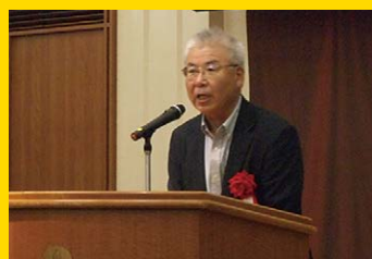
来賓 経産省 岩村課長補佐