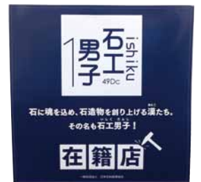
石工男子 在籍店ステッカー