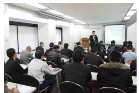
SA in Osaka セミナー