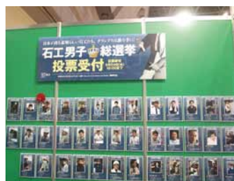
石工男子結果発表はfacebookへ