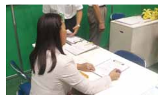
お墓ディレクター体験テスト トライアル