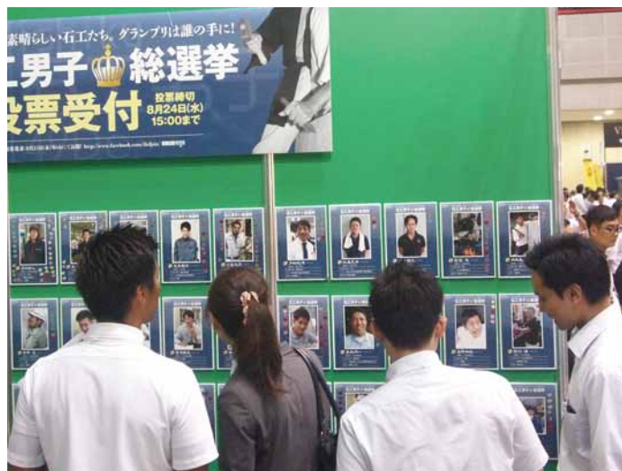
石工男子総選挙投票の様子