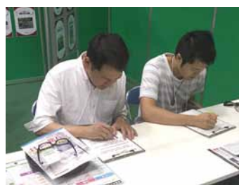
お墓ディレクター体験テスト トライアル