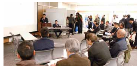
関連部会 勉強会企画「TPP」っていったい何? 関税撤廃・モノ・サービスの自由化の説明会 *今後も継続して「TPP」の内容は、関連部会として情報発信して行きます。