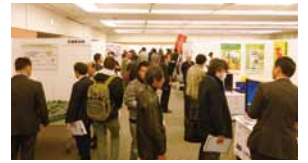
【ストーンアシスト2016 in Tokyo】 来場者アンケート集計結果

企画・運営関連部会 / 展示会実行委員会 来場者 / 2月11日:210名、2月12日:109名(合計319名)