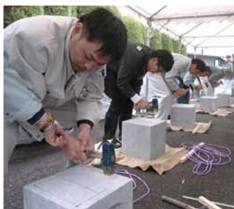
「手加工:ピシャン仕上げ」実習