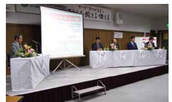
第2部パネルディスカッション