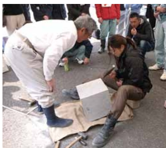
技能士からの直接指導